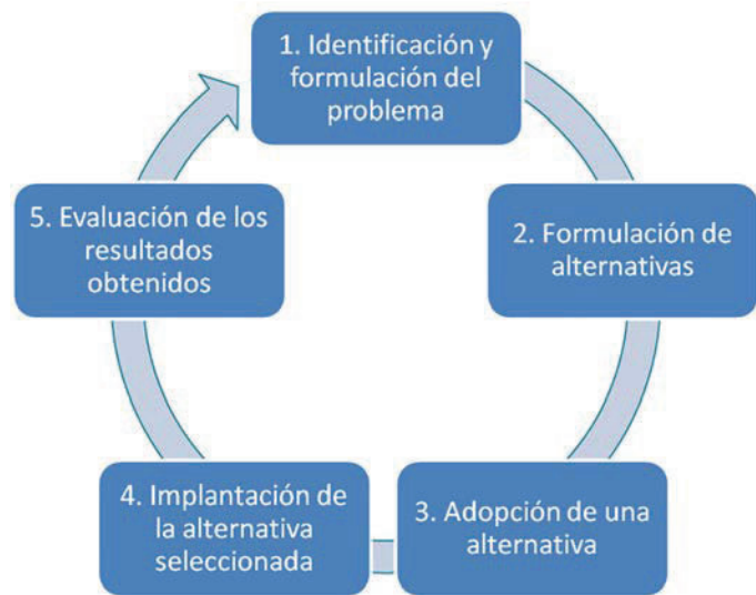
FIGURA 1 Ciclo de las políticas públicas