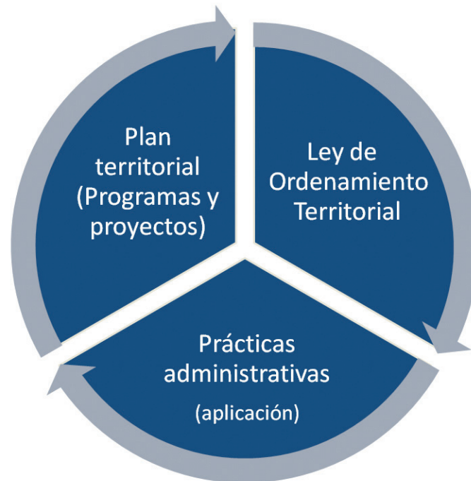
Figura 5.

el plan territorial con sus instrumentos operativos (programas y proyectos), el marco normativo que garantice su consolidación como política de Estado que trascienda instancias coyunturales de gobiernos, y un modelo de gestión (estructura organizacional y prácticas administrativas que permitan su concreción en el territorio). La inexistencia, debilidad o incongruencia de algunos de estos tres elementos condiciona fuertemente el cumplimiento de los objetivos que se pretendan alcanzar y limita el rol protagónico que debe asumir el Estado para garantizarlos (figura 5).