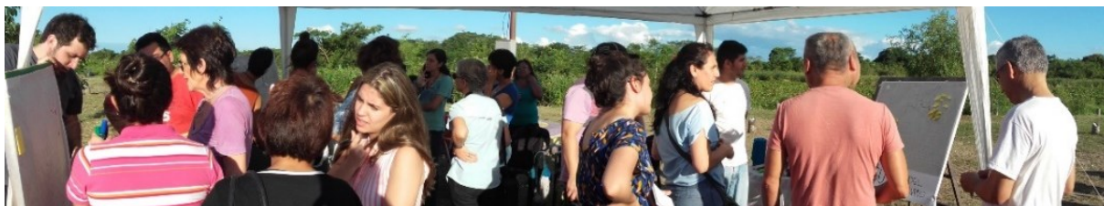
Imagen 2: momentos del mapeo colectivo en el Bº Mujeres Argentinas (ampliación).

taller deliberativo y de consenso, hasta llegar a la propuesta definitiva, la que fue plasmada en documentación técnica. Esta documentación quedó en manos de la Comisión Vecinal y del Municipio de Resistencia para la posterior gestión y materialización del parque.