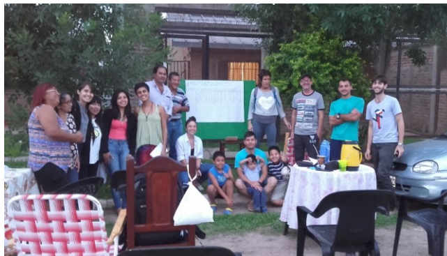
Imagen 4: Sistematización diagnóstico con los vecinos