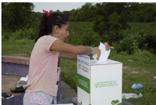
Imagen 3: Buzón de los deseos