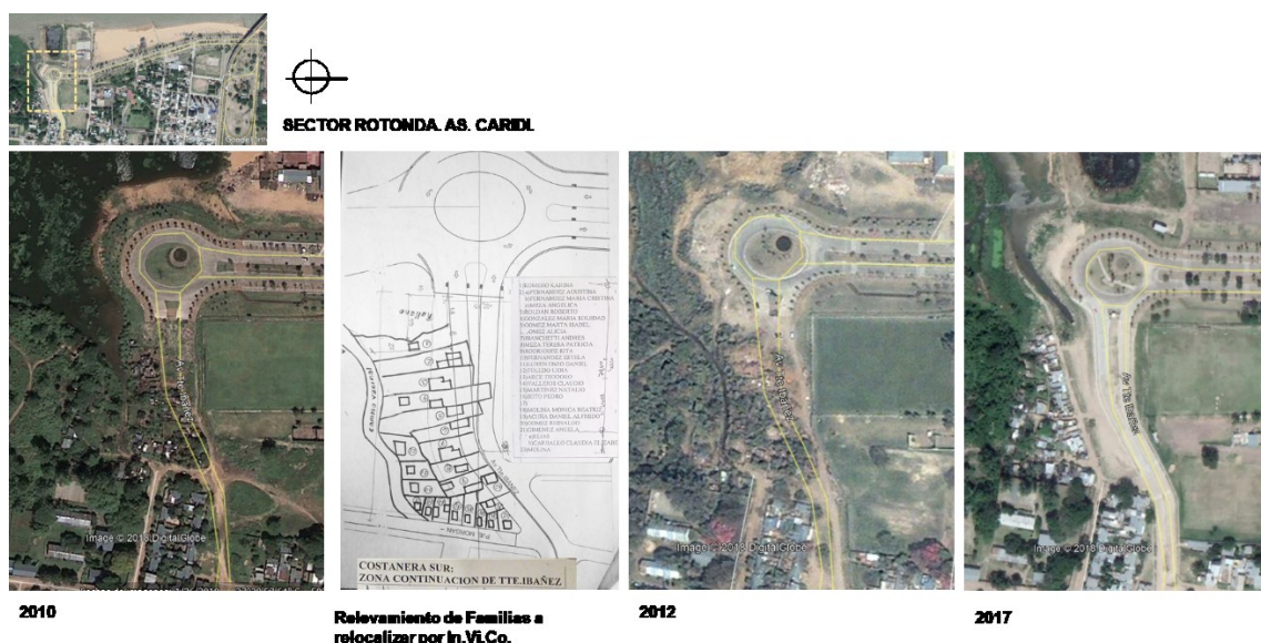
Imagen 3: Sector, As. Caridi. Relocalizado y nueva ocupación en el 2012.

Existen estudios que se enfocan en la perspectiva de los afectados, como el caso de Merlinsky (2017), (para el caso de RMBA, cuenca Matanza-Riachuelo) y reflexiona sobre los criterios implícitos en las políticas o decisiones judiciales sobre recaudos conforme a derechos humanos en estos procesos de intromisión en las condiciones de vida de las personas. (Faistein y Tedeschi, 2009, p. 5; en Merlinsky, 2017, p. 61)