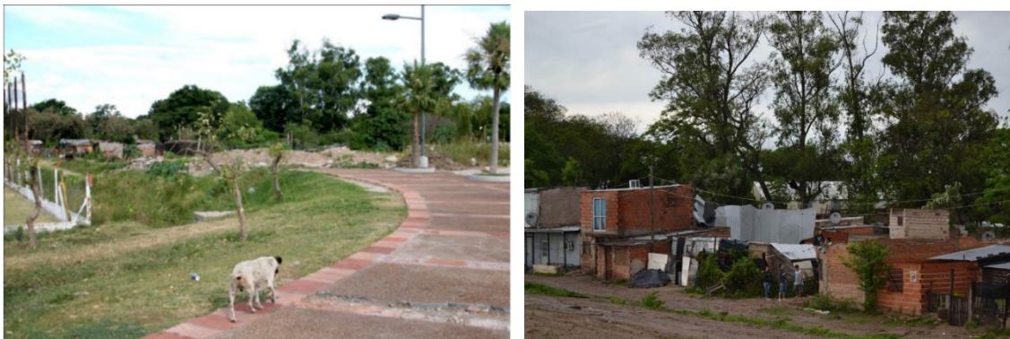
Imagen 4: (Izq.) Fotografía de Carlos Ayala. Barrio Caridi, 2012. Fuente: Barrios, 2014. Imagen 5: (Der.) Fotografía del “Bajo Caridi” y su proceso de consolidación. Fuente: Diario época, 2017.

Los alrededores a este sector, el “Bajo Caridi” y otros barrios, sufren desde el 2016 fisuras y socavamientos de la avenida Dr. Jorge Romero. Esta polémica obra se construyó sobre un antiguo entubamiento del arroyo Limita, principal desagüe de la zona sur de la ciudad. 23 Así también, luego del costo social y económico que significó, se continúan destinando millones a reparaciones insuficientes y que pregonan nuevas catástrofes.