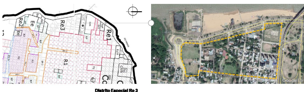
Distrito Especial Re 3

libre de manzana” (CPU, p. 43-44). Bajo estas directivas el criterio fue generar torres altas, pero con esponjamientos . 26