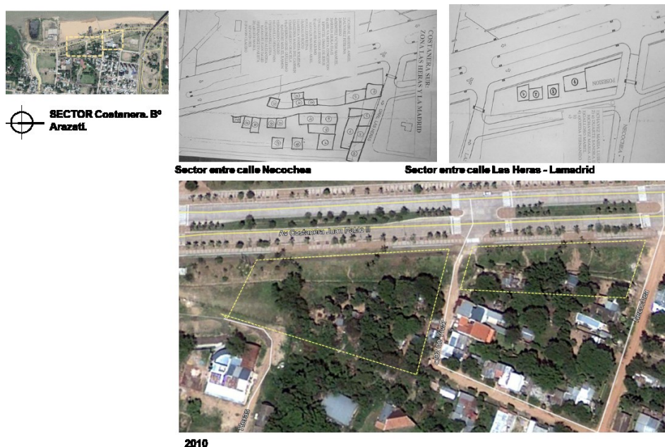
Imagen 2: Localización de viviendas previas a ser relocalizadas, As. Arazatí.

Si bien los préstamos internacionales exigen un “seguimiento” del traslado; esto se refuta en los testimonios de vecinos que relatan haber sido abandonados y estar cansados de pedir mejoras urbano-habitacionales. El Estado a partir de estos mecanismos de desposesión y exclusión genera nuevas asimetrías, donde muchas veces los vecinos trasladados buscan vender las viviendas, escapar a esta realidad impuesta y regresar al mismo lugar o trasladarse a otro barrio.