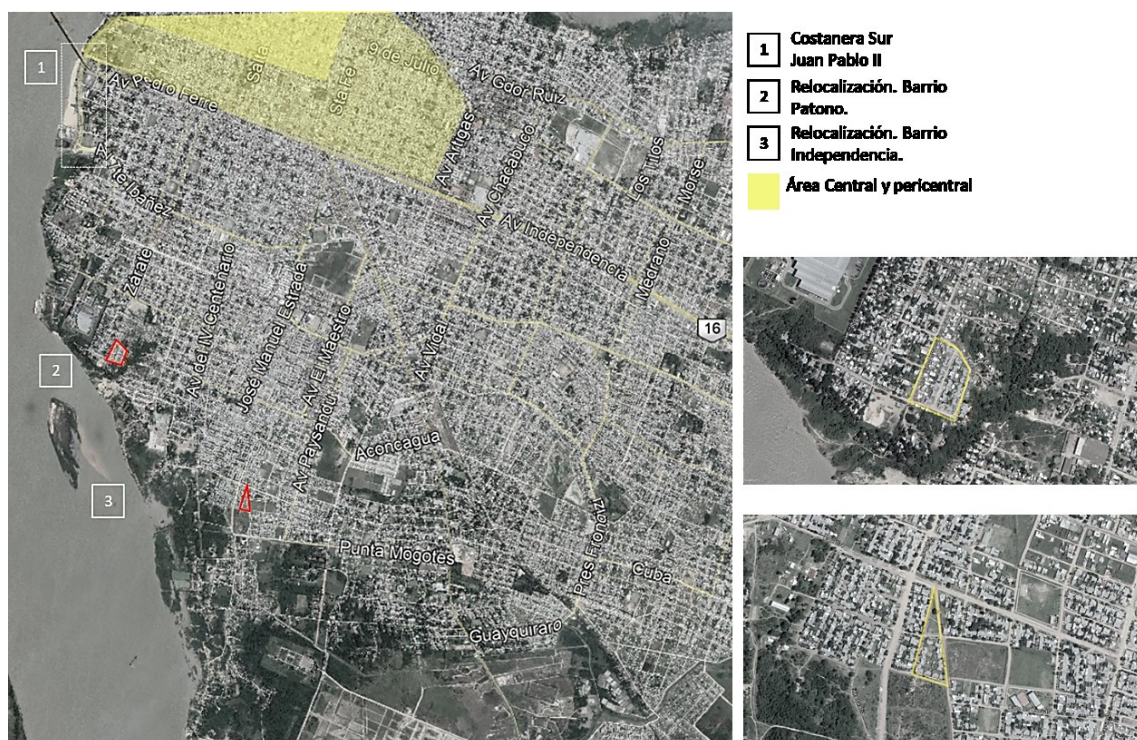
Imagen 1: Sector de la Costanera Sur, y lugares de relocalización, B° Patono e Independencia.

Los terrenos de las nuevas viviendas se localizan en la periferia, por un lado, en el B° Independencia (24 viviendas en la esquina de Paysandú e Ibera); y el otro, fruto de una cesión del municipio, en el Patono, lindero al barrio Quilmes y a la cervecería 19 . (Imagen 1)