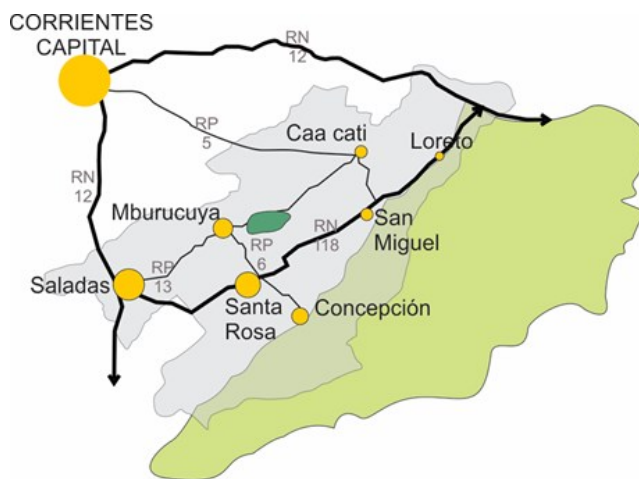
Figura 2: Región IBERA Oeste