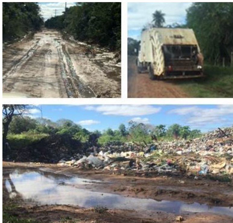
Figura 3: fotografías de los basurales existentes en la Región.

Las ciudades analizadas presentan distintos déficit en cuanto a la planificación control y monitoreo de los sistemas de recolección y disposición final. En todas la disposición final de los residuos se realiza en basurales a cielo abierto (ver figura 3) en su mayoría en proximidad a espejos de agua (con todas las implicancias ambientales negativas que conlleva), generando además una contaminación visual de sectores que deberían ser preservados para conservar sus características paisajísticas congruentes con su promoción para el Eco Turismo.