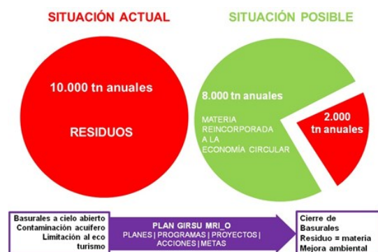
Figura 7: Escenario de implementación PGIRSU MRI-O propuestas.