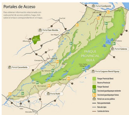
Figura 1: Sistema Natural IBERA.

El objetivo general del proyecto es la elaboración de un diagnóstico integral respecto a la gestión de residuos y disposición final de los Municipios de la MRI-O (Tabla1), a fin de proponer recomendaciones y acciones estratégicas para la implementación de mejores alternativas, la aplicación de nuevas tecnologías para el tratamiento de los RSU, la preservación ambiental, salubridad urbana, calidad de vida y el desarrollo turístico sustentable en el ámbito de la MRI-O . Importa destacar que los aportes configura un puntapié inicial respecto a la Regionalización de la GIRSU en la provincia de Corrientes, que reconoce así la importancia de definir orientaciones estratégicas de largo plazo y emprender la tarea colectiva de gestionar, participar y cambiar el manejo de los RSU de cara al futuro (Figura 1 y 2), promoviendo la cooperación interinstitucional, de manera de contribuir al mejoramiento de las condiciones sanitarias y ambientales de la región. Asimismo, no configura un Plan acabado, cerrado; por el contrario, es una propuesta de debate para ser continuada y enriquecida en los próximos años.