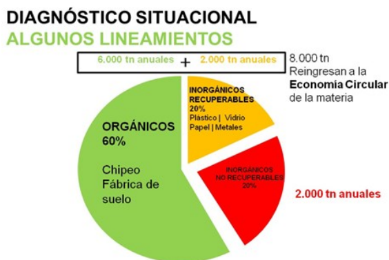
Figura 6: Escenario tendencial para la GIRSU