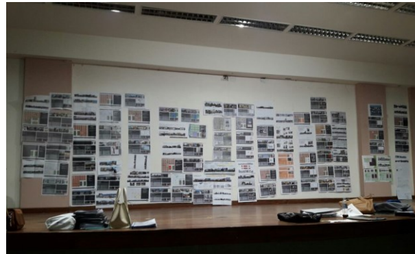
Distintos momentos de la Exposición Final de las Fichas del TP Integrador