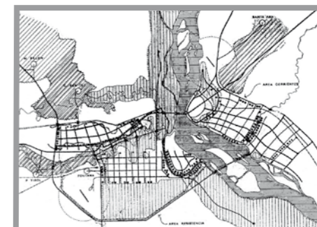
● El eje de desarrollo Corrientes – Resistencia es abordado en esta investigación desde un enfoque urbano - ambiental y atendiendo a la creciente dinámica de integración.

El trabajo de investigación, que ya se encuentra en una etapa de pleno desarrollo y cuyos primeros avances fueron expuestos en la Jornada de Comunicaciones Científicas de la UNNE realizadas en el mes de octubre pasado, ha despertado el interés de los equipos técnicos de las municipalidades de las ciudades de Resistencia y de Corrientes, precisamente el espacio territorial donde se prevén aplicar los resultados de la investigación.