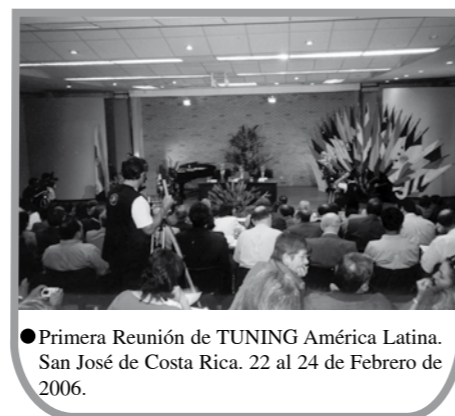
● Primera Reunión de TUNING América Latina. San José de Costa Rica. 22 al 24 de Febrero de 2006.

Avanzan los procesos de convergencia de la educación superior, en la búsqueda de un espacio común de educación superior, con el objeto de encontrar puntos de encuentro, de confluencia que permitan estructuras educativas que puedan ser mejor comparadas y comprendidas y que faciliten la movilidad de alumnos y docentes.