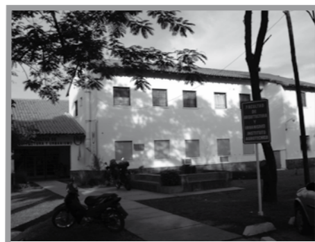
● Ex-Edificio del Instituto Agrotécnico, donde funciona actualmente el CEAHU.

Esta convocatoria, que otorga subsidios de $ 1.500.- mensuales por un período de hasta 24 meses, vence el 27 de noviembre de 2006, y habilita a cursar estas ofertas en tres centros especializados del país: la Universidad Nacional de Buenos Aires – “Política y gestión de la ciencia y la tecnología”; la Universidad Nacional de Quilmes – “Ciencia, Tecnología y Sociedad” y la Universidad Nacional de General Sarmiento – “Gestión de la Ciencia, la Tecnología y la Innovación”. El texto completo de la convocatoria puede bajarse del sitio: www.secyt.gov.ar .