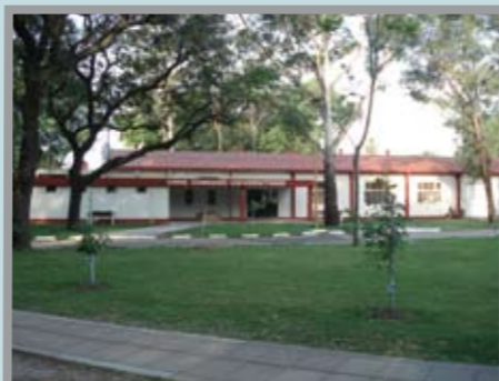
El Comedor Estudiantil de Resistencia, ubicado en el Predio del Campus, brinda el almuerzo a becarios de Ciencia y Técnica en una primera etapa.