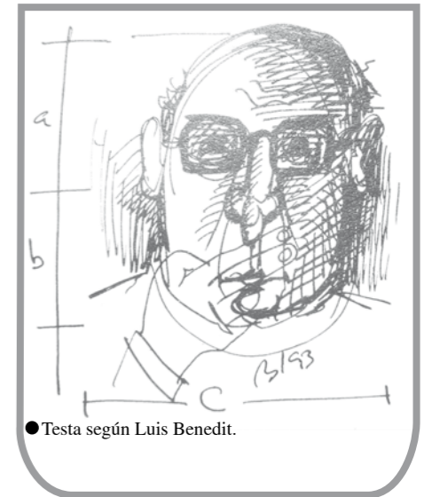
● Testa según Luis Bénédict.

En el Centro Cultural Nordeste se realizó una muestra de dibujos de Clorindo Testa el día 15 de septiembre, bajo el título de “La Ciudad Testa”. De esta forma se trató de poner de manifiesto la dualidad de Arquitecto y Artista que acompaña y brinda un sello creativo y personal a la obra de Clorindo Testa, que de sus propias palabras nos dice: “La pintura y la arquitectura están unidas”, el mecanismo de creación es igual, es un trabajo artístico si está concebido en la imaginación.”