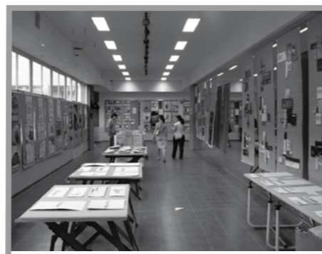
● La vida universitaria plantea nuevas vivencias y experiencias. La Universidad y la facultad disponen de distintos mecanismos institucionales para guiar y facilitar el tránsito normal del alumno.

“ Cada Facultad es una unidad administrativa y de gobierno y se organiza a partir de un Consejo Directivo – principal órgano de gobierno junto al Decano y los Secretarios, quienes organizan el trabajo de áreas, departamentos, institutos, cátedras y otros cursos que integran la facultad. ”