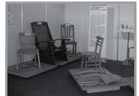
● Exhibición del Sillón “Riwa” y de otros asientos desarrollados en el mismo Curso, en la Feria Internacional del Mueble 2005 en Buenos Aires.

Este informe fue presentado a la Comisión Legislativa el 30 de noviembre al Presidente de la misma Ing. Guillermo Agüero y otros miembros con la intervención del Decano de la FAU y los asesores que intervinieron. Resulta destacable la interacción realizada y la posibilidad de intervención que se ha dado a la Facultad en un tácito reconocimiento de sus pertinencias y capacidades, lo que permite esperar que se continúe consultando y posibilitando la prestación de servicios a instituciones gubernamentales del medio cumpliendo con objetivo propio de la gestión universitaria.