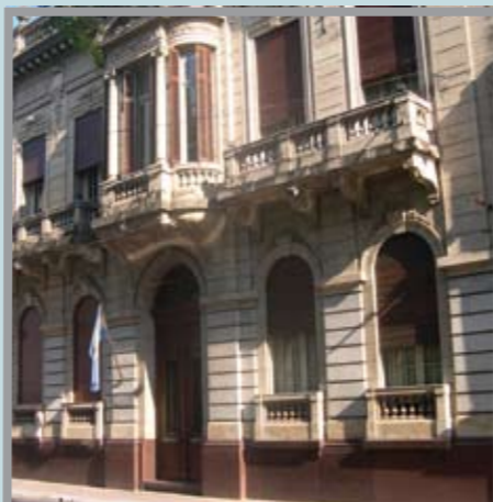
Entre las Actividades del mes se destacan los festejos por el 50° Aniversario de la Universidad, con los actos centrales el día 14 de Diciembre.