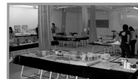
● El día 20 de diciembre se realizará el Acto de Cierre de la Exposición con la presencia de alumnos, docentes e invitados especiales. Imagen de la 2 a Edición realizada en diciembre de 2005.

En el acto de cierre de la exposición que será el día 20 en horas de la tarde, se entregarán los resultados de los trabajos que desarrollaron en el período 2005 – 2006 los grupos de alumnos del último nivel (Trabajo Final de Carrera), en el marco de Acuerdos de Trabajo suscriptos por la Facultad con instituciones de la región, al que han sido invitados Intendentes y autoridades de ambas provincias.